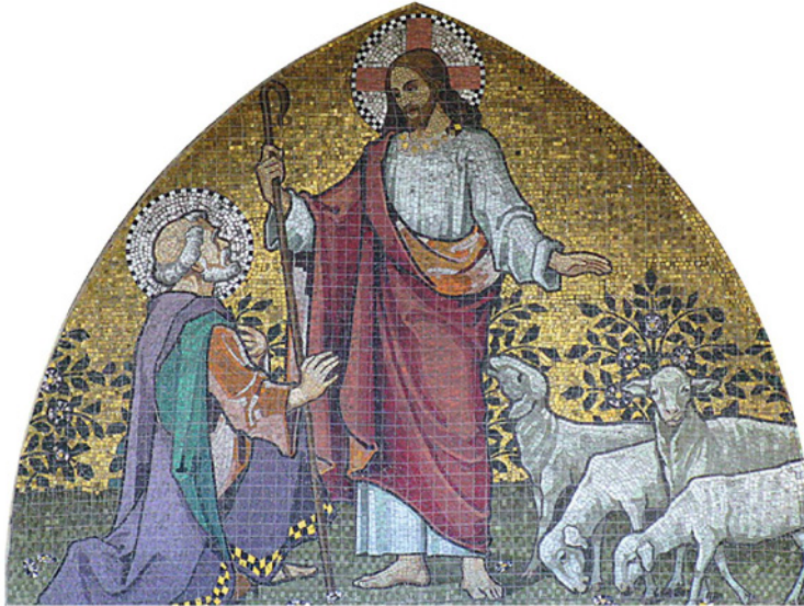
Ein winziger Dialog, ein großer Moment

Jesus nimmt Petrus zur Seite und stellt ihn auf die Probe. Dreimal fragt Jesus: Petrus, liebst du mich? Liebst du mich mehr als die anderen Jünger? Dreimal antwortet Petrus: Du weißt es doch, Herr. Ein winziger Dialog, ein großer Moment. Der Heiland, der Auferstandene, bittet um Liebe. Und erbittet sie von dem, der ihm am meisten wehgetan hat. Petrus weiß, warum er gefragt wird. Und hört dann, warum das so wichtig ist.