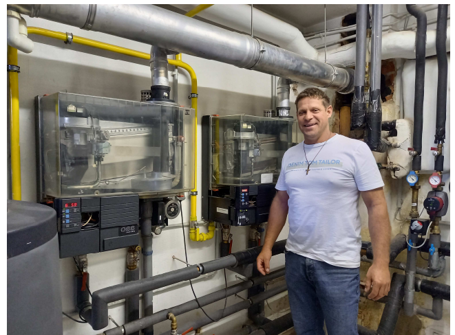
Die alte Gasheizung soll durch eine Erdwärmeheizung ersetzt werden.

Im Gemeindeamt inkl. Wohnungen wird die in die Jahre gekommene Gasheizung durch eine Erdwärmeheizung ersetzt. Da der Servicevertrag für die bestehende Heizung nicht verlängert wurde, hat sich die Gemeinde dazu entschlossen eine alternative Heizungsanlage zu errichten.